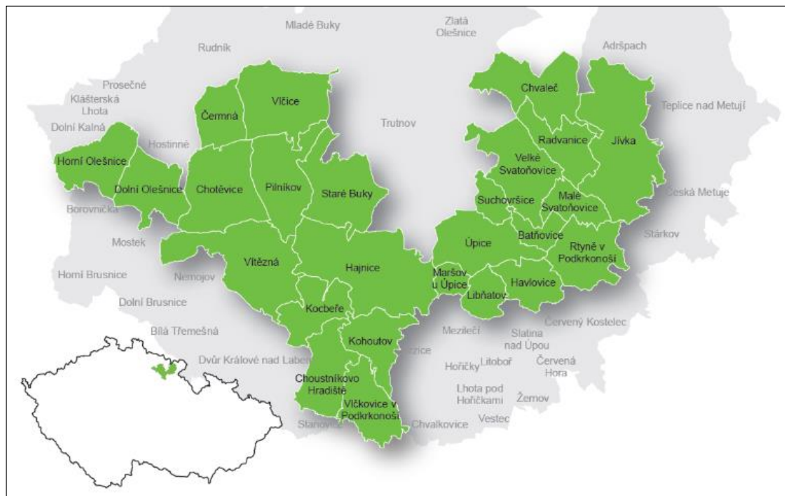
Mapa 2 Území působnosti MAS Království – Jestřebí hory, o.p.s. v kontextu regionů NUTS2 a NUTS3 2