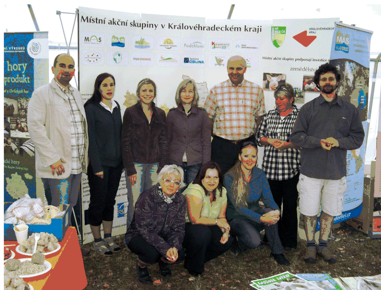
Prezentace MAS na Královéhradeckých krajských Dožínkách v září 2009.